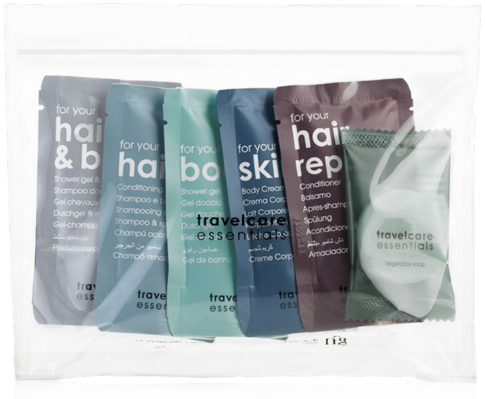
SAMPLE SACHET TRANSPARENT BUSTA CAMPIONARIO TRASPARENTE TÄSCHCHEN FÜR AMENITIES POCHETTE D'ÉCHANTILLONS BOLSITA TRANSPARENTE PARA MUESTRAS DYP6_20MTRE, DYP6_15BTRE, DYP6_15STRE, DYP6_15BLTRE, DYP6_15CTRE, B0808TRE